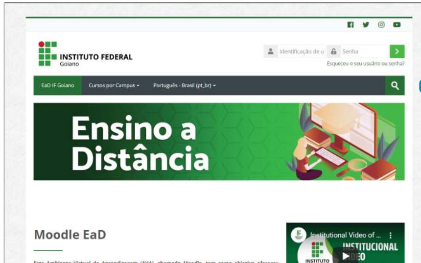
Figura 8: Página inicial do Moodle para alunos do EAD.