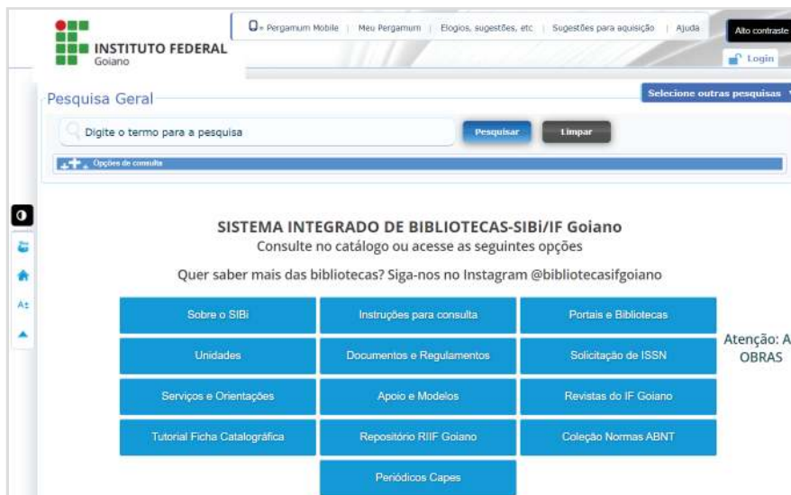
Figura 6: Página inicial do Pergamum.