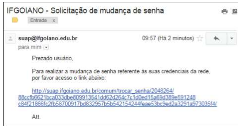
Figura 3: Link enviado para o e-mail do estudante.