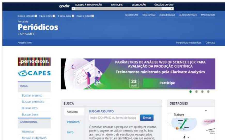
Figura 7: Página inicial do Portal de Periódicos.