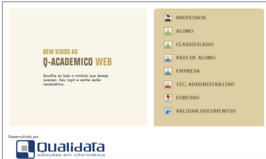
Figura 5: Página inicial do Q-Acadêmico Web.